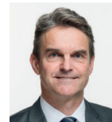
CN Beat Walti Représentant Parlement Conseiller national PLR Zürich ZH